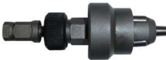
Конструкция вальцовки для труб с внутренним диаметром более 12 мм