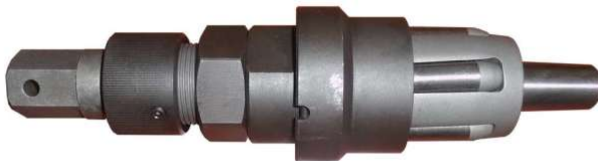
Конструкция вальцовки "5СК"