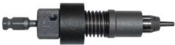
Конструкция вальцовки для труб с внутренним диаметром до 12 мм

Вальцовки указанных моделей применяются для закрепления труб, имеющих погиб вблизи трубной решетки, а также для для закрепления тонкостенных нержавеющей труб в соединительных фланцах при монтаже трубопроводов на предприятиях пищевой промышленности.